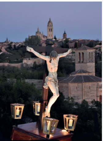
3º Premio: "Sufrimiento" Autor: Antonio de Antonio García