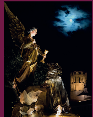
2º Premio: "Luna de Pasión" Autor: José Manuel Rodrigo Garzón