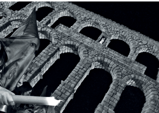
Mejor Colección. Título: "Contraste" Autor: Juan Esteban Martín