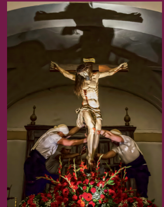
1º Premio: "Cuidando al Señor" Autor: Rubén Pascual López